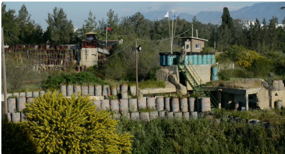
Η ΙΣΤΟΡΙΑ ΤΗΣ ΠΡΑΣΙΝΗΣ ΓΡΑΜΜΗΣ του Πανίκου Χρυσάνθου trailer new star

Σημείωση: Απόσπασμα ταινίας με θέμα την πράσινη γραμμή. Είναι κατάλληλο για παιδιά άνω των 12 ετών. Δευτερόλεπτα 17-20 από το κλιπ να μην προβληθούν- ΑΚΑΤΑΛΛΗΛΟ περιεχόμενο